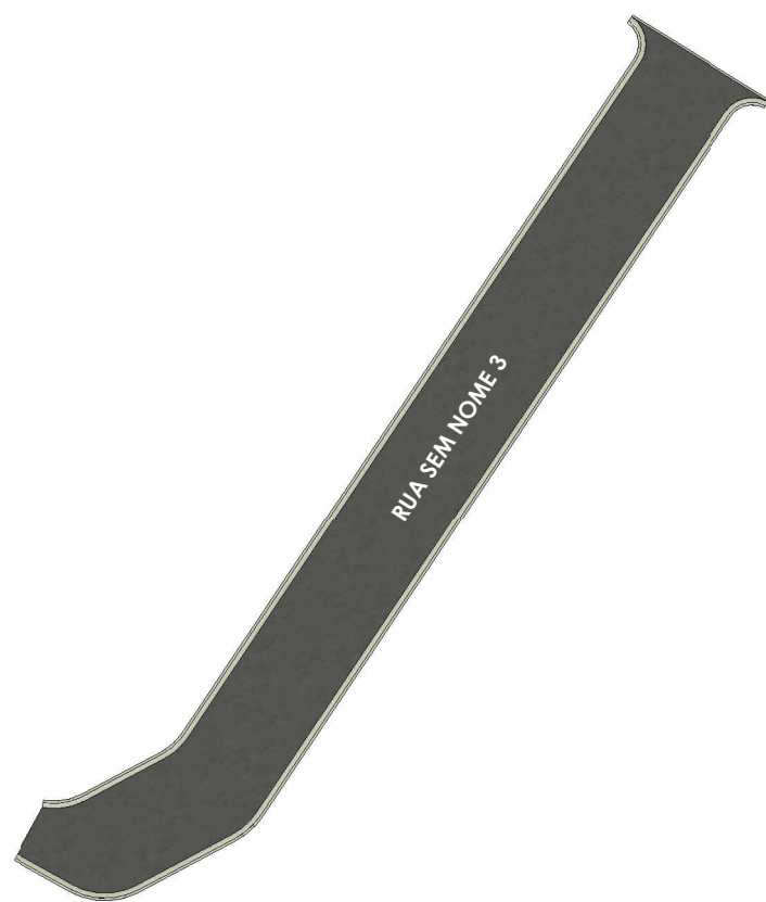
PLANTA HUMANIZADA - RUA SEM NOME 3 ESC: 1 : 500